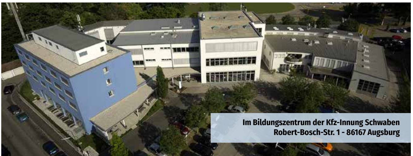
Im Bildungszentrum der Kfz-Innung Schwaben Robert-Bosch-Str. 1 - 86167 Augsburg

Der Unterricht wird von erfahrenen haupt- und nebenberuflichen Lehrkräften und Dozenten erteilt. Im Bildungszentrum stehen den Lehrgangsteilnehmern Geräte und Einrichtungen zur Verfügung, die ständig dem neuesten Stand der Automobiltechnik angepasst werden.