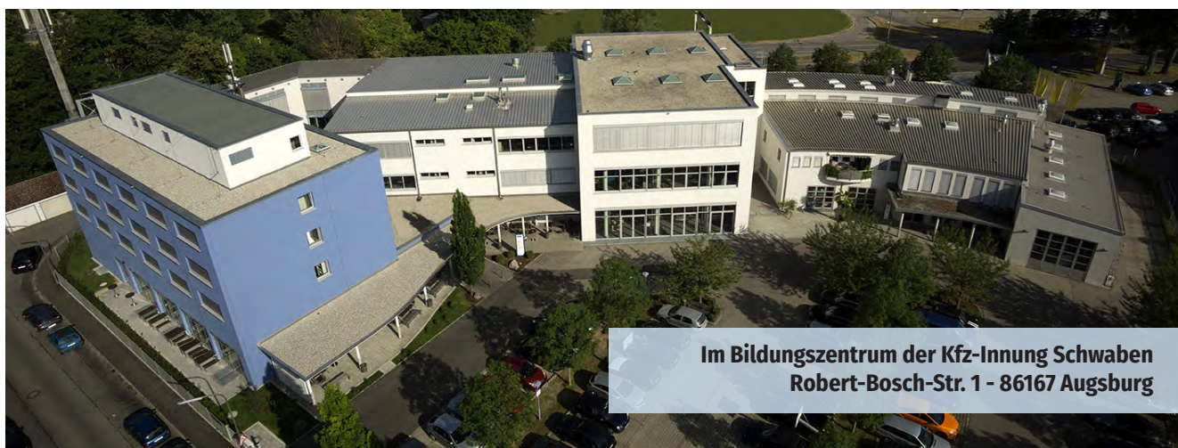
Im Bildungszentrum der Kfz-Innung Schwaben Robert-Bosch-Str. 1 - 86167 Augsburg

Der Unterricht wird von erfahrenen Haupt- und Nebenberuflichen Lehrkräften und Dozenten erteilt. Im Bildungszentrum stehen den Lehrgangsteilnehmern Geräte und Einrichtungen zur Verfügung, die ständig dem neuesten Stand der Automobiltechnik angepasst werden.