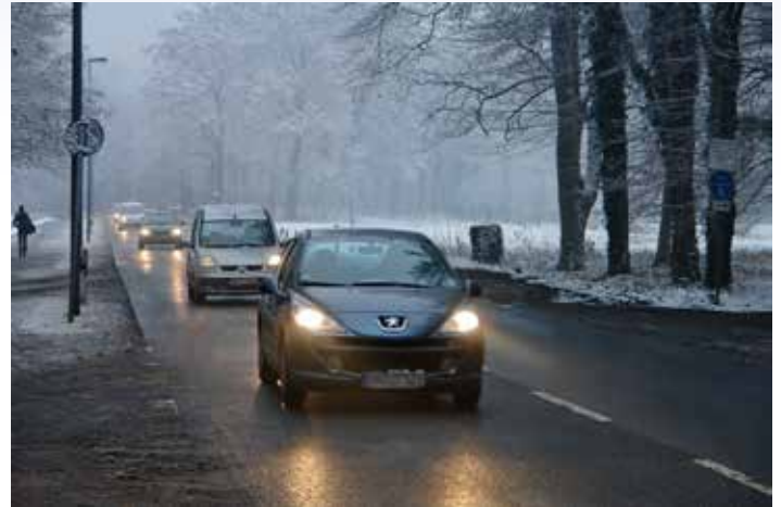
Die Scheinwerfer sollten – vor allem im Winter – regelmäßig geprüft werden.

Ins Wischwasser gehört im Winter nicht nur Frostschutz, es sollte auch speziell für die empfindlichen Polycarbonat-Scheiben zugelassen sein. Beim Kauf also auf Hinweise wie „Kunststoffverträglich“ oder „für Polycarbonat geeignet“ achten.