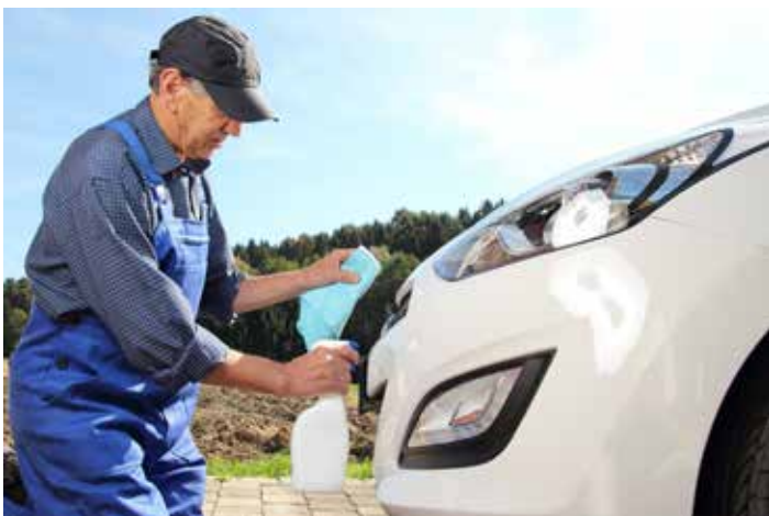
Verschmutzte Scheinwerfer blenden. Mit weichen Tüchern und viel Wasser kommt schnell wieder Licht ins Dunkel.